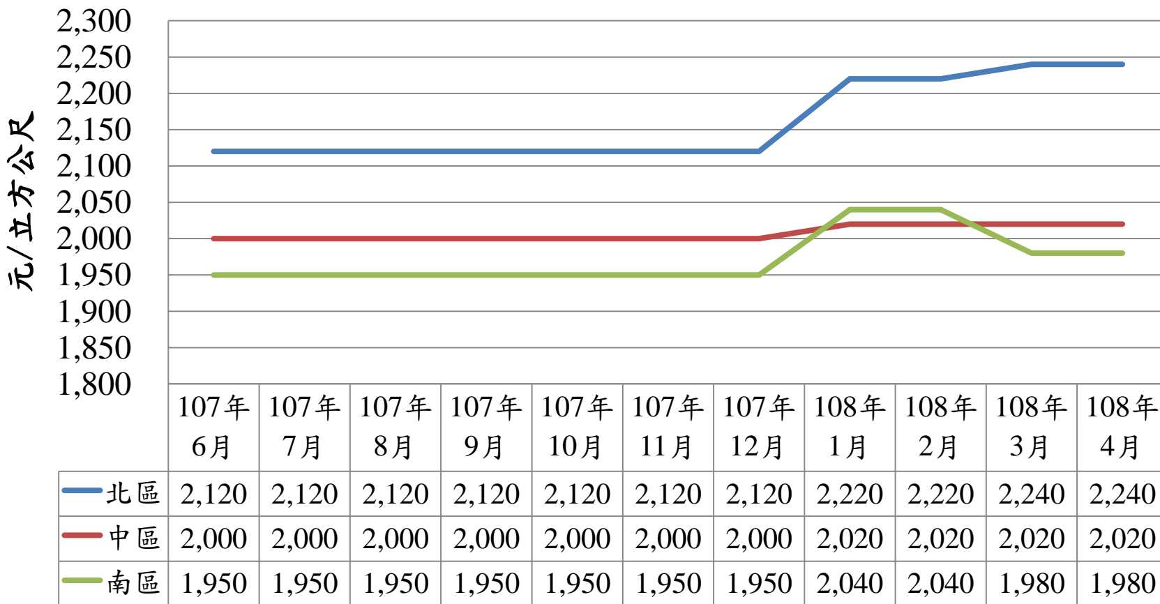
107年6月至108年4月北中南區預拌混凝土價格表