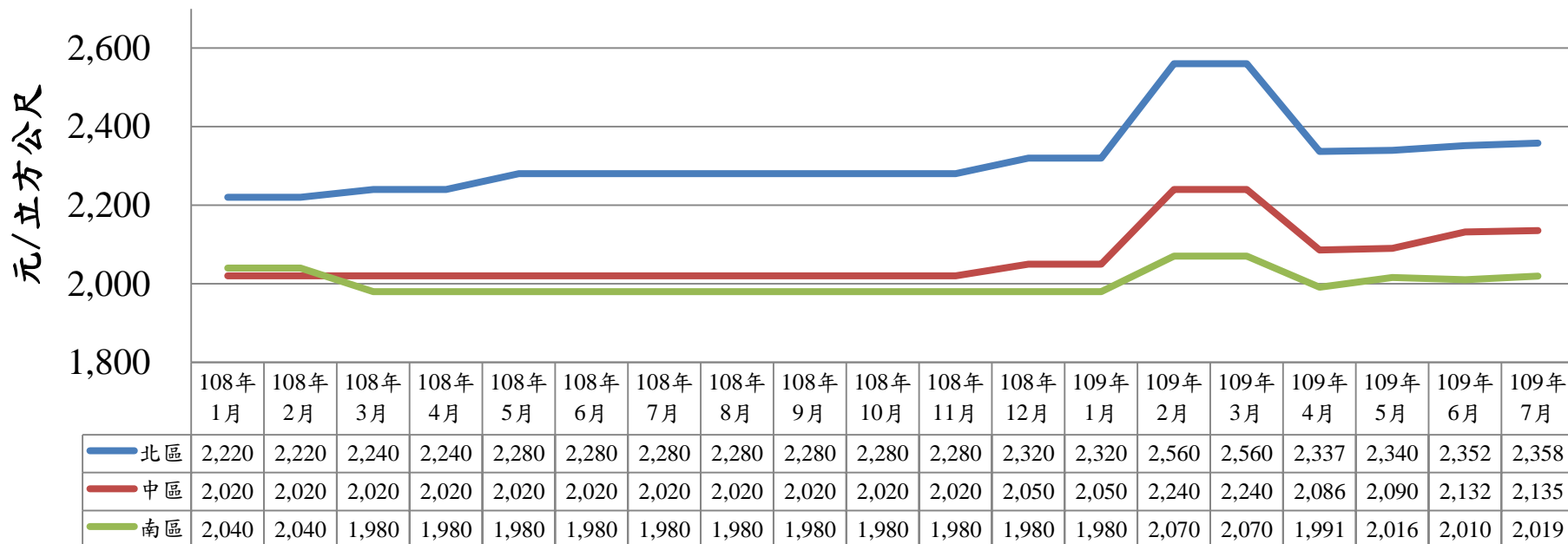
108年至109年7月北中南區預拌混凝土價格表